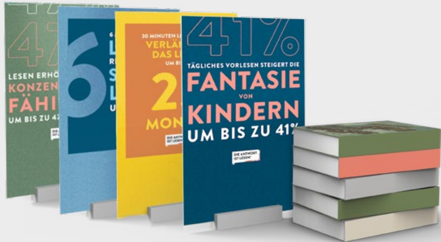
Im Bild 4 von 7 Aufstellern