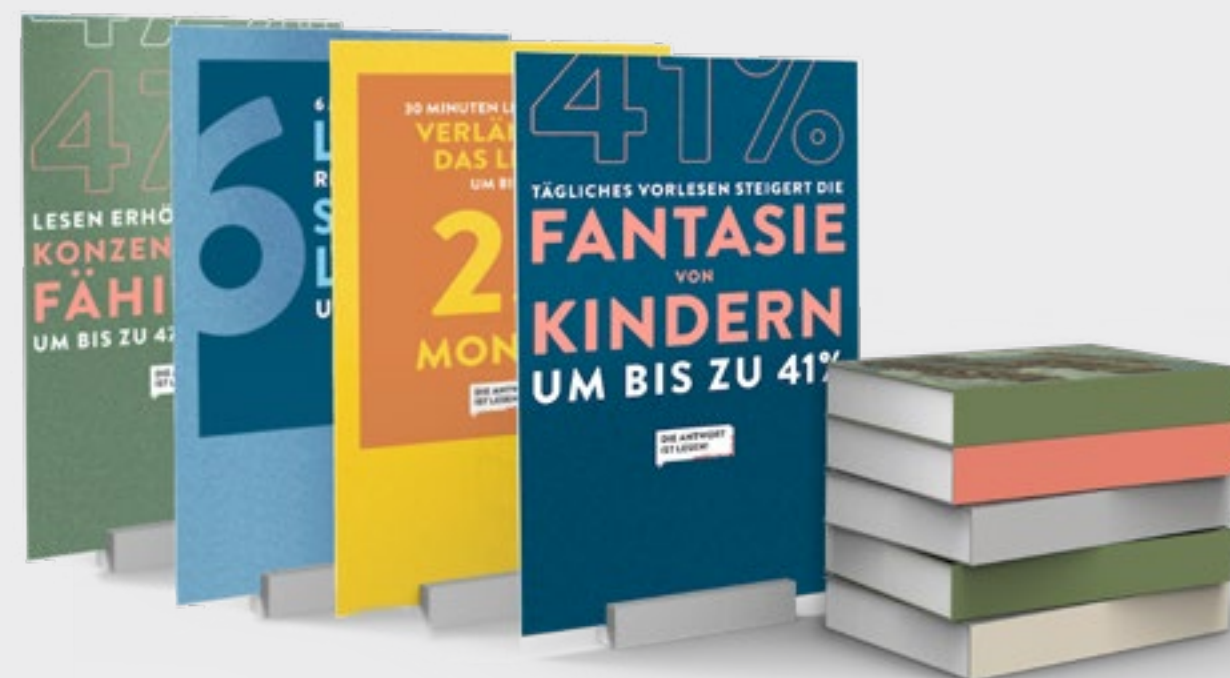
Im Bild 4 von 7 Aufstellern