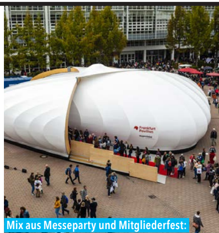
Mix aus Messeparty und Mitgliederfest: Die Branche feiert im Frankfurt Pavilion