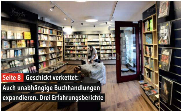
Seite 8 Geschicht verkettet: Auch unabhängige Buchhandlungen expandieren. Drei Erfahrungsberichte